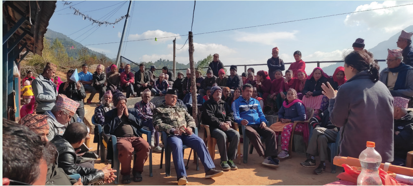
थामतलेत्रो सा.व.उ.स.आँधीखोला-४, समूहको आम भेलामा छलफलमा सहभागीहरू