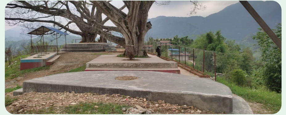
करेन्डौँडा हरित पार्क निर्माण स्थल पुतलीबजार-११, स्याङ्जा