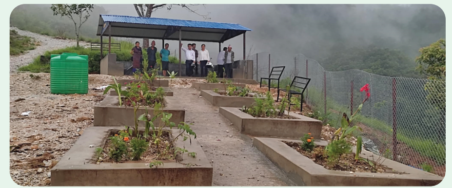
हरियाली उद्यान निर्माण, देउराली सा.व. पुतलीबजार न.पा. ८, वहाकोट, स्याङ्जा