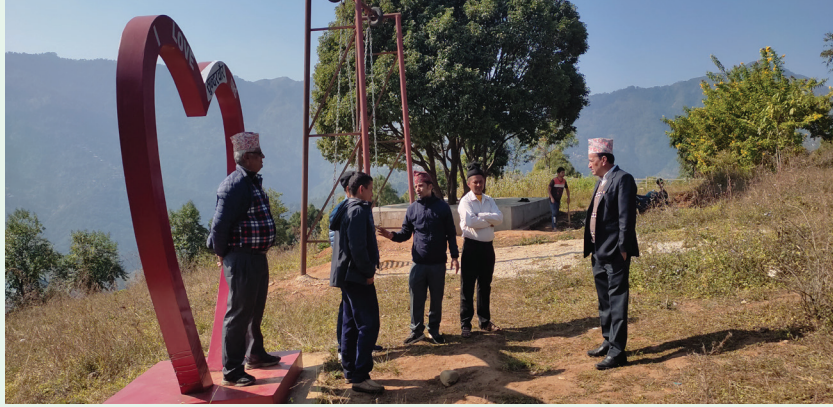
सुन्दरचौर वनस्पती सूचनाकेन्द्र, भिरकोट न.पा.-६, स्याङ्जा