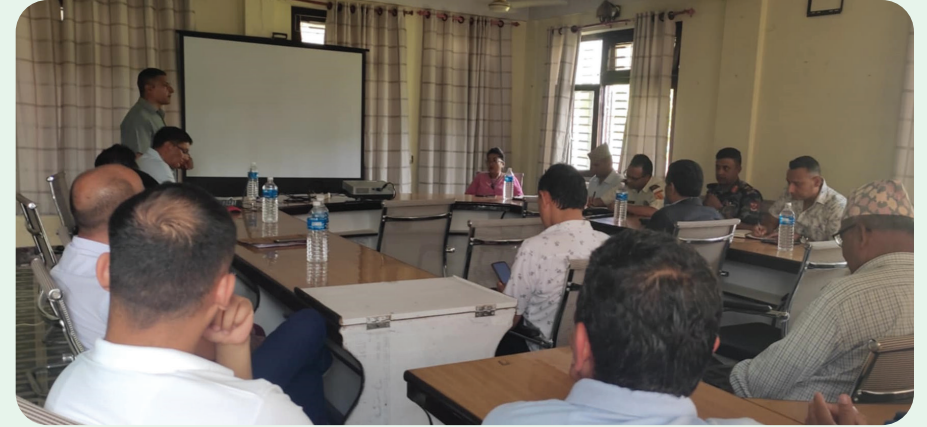
वन डडेलो नियन्त्रण तथा व्यवस्थापनका लागि सरोकारवालाहरूसँग अन्तर्क्रिया