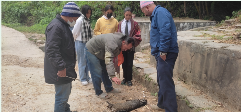
मृत वन्यजन्तु भार्से (ओत) को उद्धार गर्दै कर्मचारी तथा स्थानिय